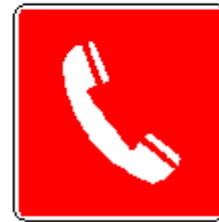
Telefono per interventi antincendio